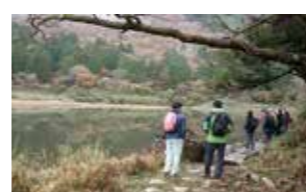
恩賜箱根公園 → 杉並木道 → お玉ヶ池 → 精進池前