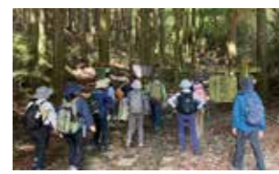
甘酒茶屋 → 杉並木道 → 恩賜箱根公園 → 箱根関所

旧街道の石畳を歩き、昔の箱根に思いを馳せます。町学芸員による、関所内のガイド付きです。