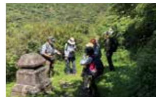
精進池前 → 東光庵 → 井天神社 → 湯坂路入口 → 鷹巣山 → 笛塚バス停