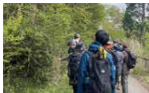
箱根ビジターセンター → 湖尻新橋 → 耕牧舎跡 → 温湯 → 箱根湿生花園