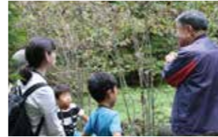
箱根ビジターセンター1階周辺

五感を使って自然を楽しみながら、のんびりと歩きましょう。親子でもおひとりでもお気軽にご参加ください。