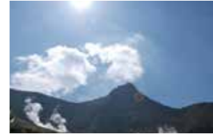
箱根ビジターセンター → 船大岩 → 姥子 → 大涌谷 → ミ箱根1階

40万年におよぶ箱根火山活動の痕跡を一緒に辿りましょう。サンショウバラ等の初夏に咲く花もお楽しみに！