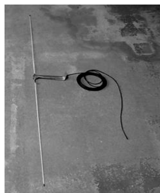
ダイポールアンテナ