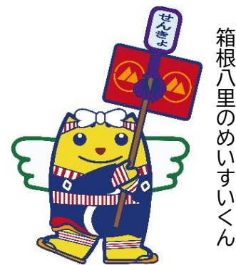
箱根八里のめいすいくん