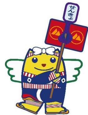
箱根八里のめいすいくん