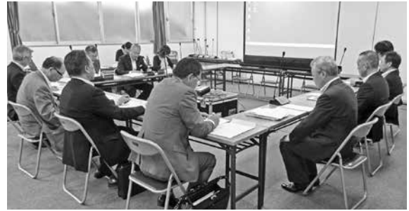
総務企画観光常任委員会の様子