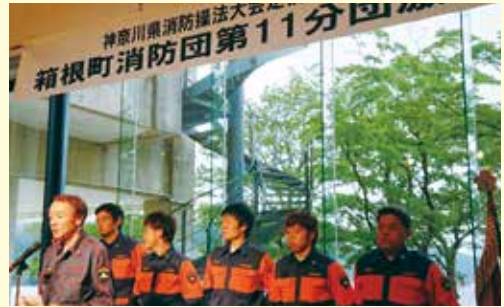
7月3日 壮行会を実施

7月25日開催の神奈川県消防操法大会に係る査閲及び壮行会に正副議長等が出席し、激励してきました。