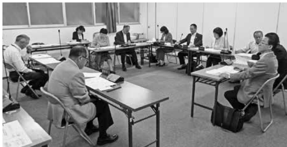
教育福祉環境常任委員会の様子

6月15日に会議を開き、教育長・教育委員会担当職員の出席のもと、施工業者も決まった箱根中学校校舎等長寿命化改良工事についての詳細な説明を受けました。