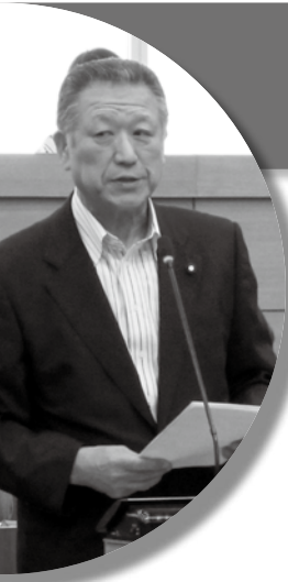
勝俣 公好 議員

Q 私は、兼ねてから南足柄市と箱根町を連絡する道路が開通するにあたって、仙石原交差点の渋滞が予測されるので、改良計画を進めてほしいと要望した。しかし、地権者と合意が得られず、進展しなかったことは承知している。