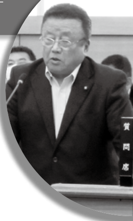
石川 栄 議員