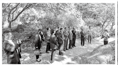
ジオサイトの有珠善光寺を視察