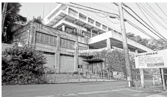
湯本分署建設予定地