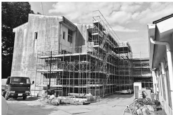
長寿命化改良工事は着実に進んでいる