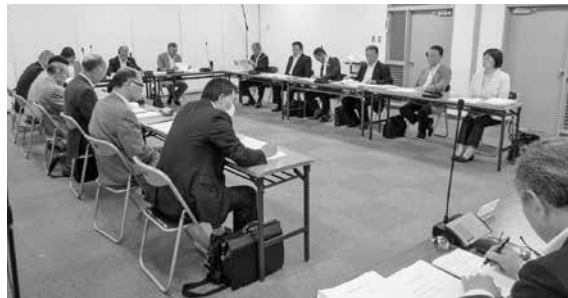
行財政改革調査特別委員会の様子

行財政改革調査特別委員会は、新年度に入り4月25日に第7回目の開催を皮切りに、6月末までに4回の特別委員会を開催し、通算10回の会議を開催しました。7回目は、今後起こる財源不足額の要因について協議し、公共施設再編計画などの投資的経費に対する算定が人口減少の現実に即しているのか、職員数確保の必要性の根拠と住民サービスへの影響についてなど調査研究を行いました。