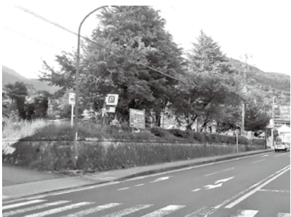
バスターミナル計画が提案された旧保育園跡地

A そこに、小田急箱根ホールディングスから旧保育園跡地でのバスターミナル計画が提案され、仙石原地域総合整備協議会も地域活性化が図れるものとして賛同し、これを機に交差点改良工事も同時に進めてほしいと要望が出た。そこで、仙石原交差点周辺まちづくりについて伺う。推進方策はどのように行うのか。 A バスターミナル整備や交差点改良、まちづくりといったそれぞれの事業が相互に連携されることで、その効果が発揮されると考える。交差点改良は過去の経緯から、