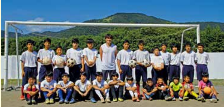
参加者には小学生の姿もありました