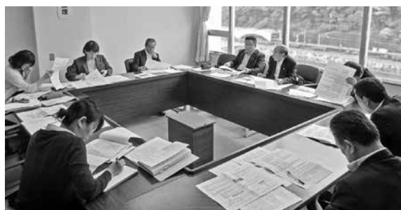
議会改革等推進特別委員会の様子

また、「平成30年度箱根町議会の活性化に向けた理念と方針」を新たに作成いたしました。前任期における議会の意思を引き継ぎ、町民の代表としてその負託に応えるため、「町民から最も頼りにされる議会」を基本理念に据え、議員一丸となって、自らの創意工夫と町民との協働のもと、町民に開かれた参加しやすい議会の実現や公正で透明性の高い議会運営の推進を図るとともに、議員の資質向上や町民の視点に立った政策立案、提言が行えるよう、議会機能の強化に努めて参ります。