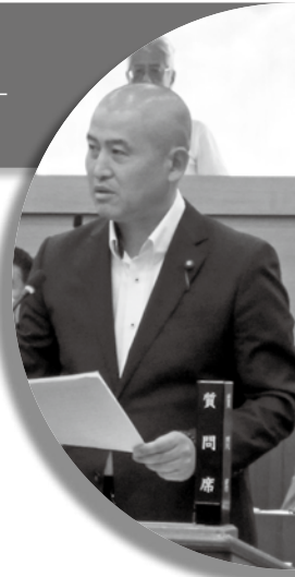
山田 成宣 議員

Q 環境センターの周辺地域においては、依然として悪臭等にストレスを感じている住民も少なくない状況であることを、箱根町全体の意識として再認識していただきたい。そこで、ごみ処理施設の広域化に向けた作業の現状と、今後の課題について町長の所見を伺う。