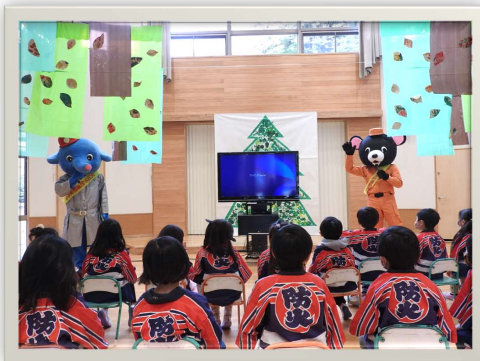
【 ポンプ君とレスキュー君の防火広報 】