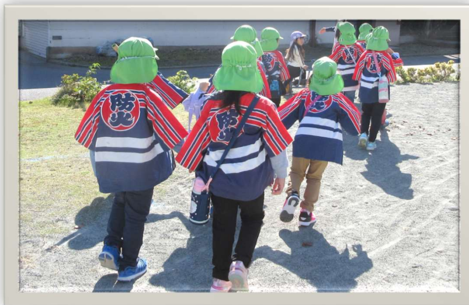
【 幼年消防クラブ 法被通園 】