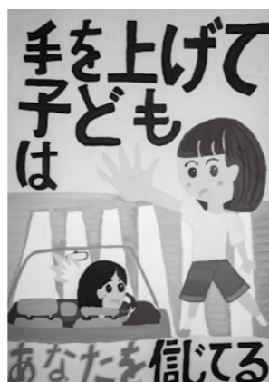
最優秀賞 箱根町長賞