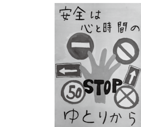
特別賞 箱根町交通安全母の会会長賞 箱根中学校1年