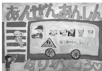
特別賞 箱根町教育委員会教育長賞 箱根の森小学校1年