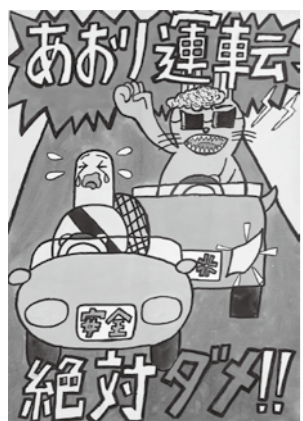
優秀賞 (中学生の部) 箱根中学校1年