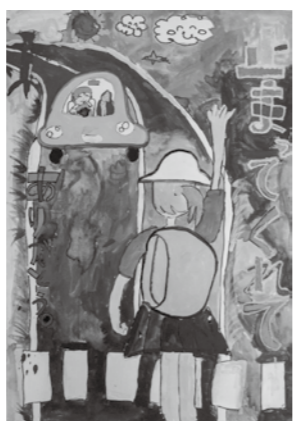
特別賞 小田原交通安全協会会長賞 湯本小学校2年