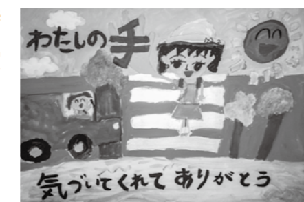
特別賞 箱根町交通安全都市推進協議会会長賞 仙石原小学校2年