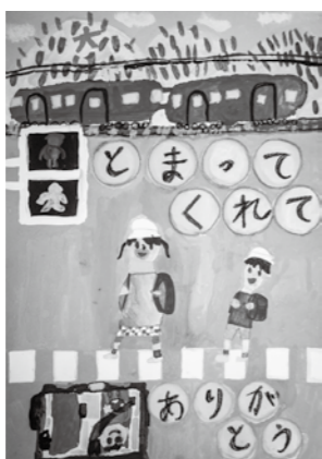
優秀賞 (小学生の部) 湯本小学校2年