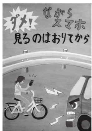
特別賞 小田原警察署署長賞