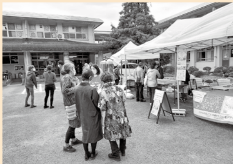
10月22日(土)「はこねっこマルシェ」にて、「箱根町子育てシェアタウン」ブースでの様子