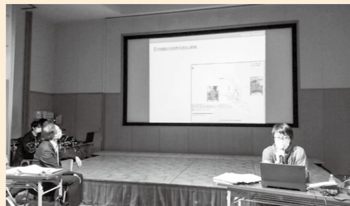
大会中に行われた自然災害伝承碑の分科会では、箱根ジオパークの取り組みを紹介しました。