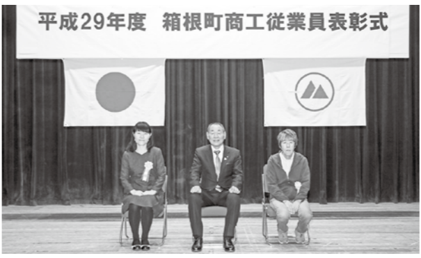
平成29年度 箱根町商工従業員表彰式