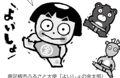
南足柄市ふるさと大使「よいしよの金太郎」

「御嶽神社」へは、伊豆箱根鉄道大雄山線「相模沼田駅」から徒歩約45分 ※「南足柄ジオガイドの会」がご案内します お気軽にお問い合わせください！ (Tel.0465-73-8001)