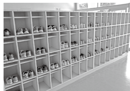
箱根の森小学校の下駄箱（湯本小学校と仙石原小学校の下駄箱も同様です）