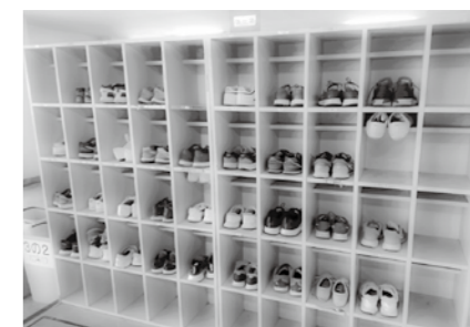
箱根中学校の下駄箱

※下駄箱の靴は、小・中学校ともにいつでも綺麗に整列しており、小学校で身に付いた習慣は中学校に引き継がれています。