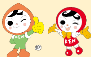
人KENまもる君 人KENあゆみちゃん 人権イメージキャラクター