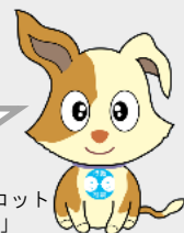
行政相談マスコット 「キクーン」

※相談方法や対応時間は、各相談窓口により異なります。詳しくは各相談窓口のホームページをご覧ください。