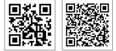
コロナワクチンナビ 2次元コード 町ホームページ 2次元コード

2回目接種を完了した12歳以上の方を対象にオミクロン株対応ワクチンの接種が始まります。今後、3回目以降の接種を希望される方は、このワクチンを接種することになります。まだ一度もワクチンを接種していない方で、ワクチン接種を希望する場合は、ワクチン接種対策室へ問い合わせてください。ワクチン接種後に箱根町へ転入した方は、「接種券発行申請書」により申請が必要です。申請は、「コロナワクチンナビ」からも行えます。