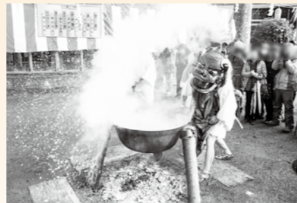
仙石原湯立獅子舞