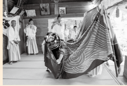
宮城野湯立獅子舞

期間 10月1日(土)～11月27日(日) 時間 9時～16時30分(最終入館は16時まで) 休館日 毎週水曜日(11月23日(水・祝)は開館)、毎月最終月曜日 入館料 大人(高校生以上)300円 小中学生150円 ※期間中、町内在住の小中学生は無料