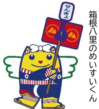
箱根八里のめいすいくん

令和4年3月22日以降に新住所地に転入の届出をした方 → 新住所地では投票できません ※ただし、箱根町で投票できる場合がありますので、選挙管理委員会に問い合わせてください。