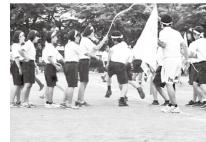
運動会(箱根中学校)