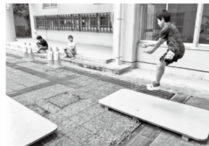
短縄ギネスに挑戦(箱根の森小学校)