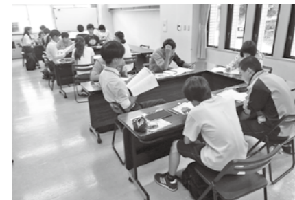
8月21日(火)に、箱根土曜塾の開講式を行いました。