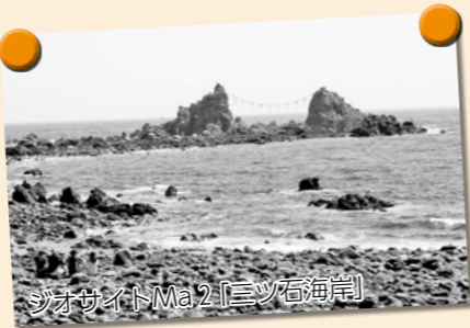
ジオサイトMa2「三ツ石海岸」

夏休みも終わってこれから少しずつ涼しくなるね。おいらは、箱根ジオパーク真鶴エリアの拠点施設「真鶴町立遠藤貝類博物館」にやって来たよ。ここは、貝類の研究家、遠藤晴雄氏が生涯をかけて集めた4,500種、50,000点の貝類を収蔵して日本の貝類だけでなく、世界の貝も展示しているよ。