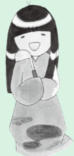
箱根関所マスコット「たま」

箱根ジオミュージアムでは、この「地質の日」にちなんで、箱根の地図にぬり絵をして地質図をつくる特別イベントを開催した。