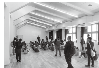
多目的室を使った小6学校説明会