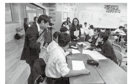
教室を使った園小中教員一貫教育研修