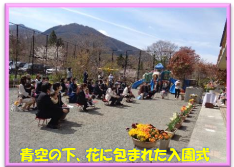
青空の下、花に包まれた入園式

『そよかぜ』のように爽やかで心地よい幼児学園でありたいと願ひ、毎月配信しています。