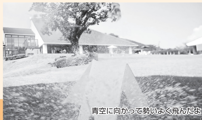
青空に向かって勢いよく飛んだよ