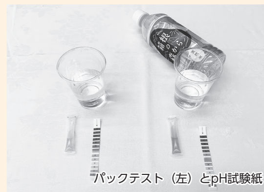
パックテスト(左)とpH試験紙