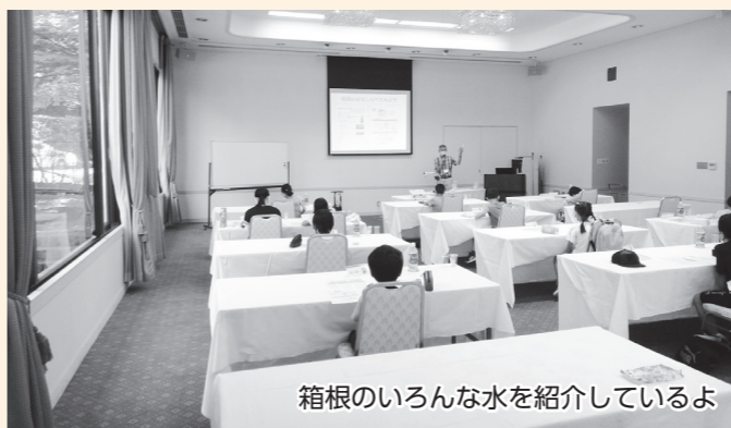
箱根のいろんな水を紹介しているよ

「ペットボトルを使って工作しよう!」では、はさみとテープを使ってペットボトルロケットを作ったよ。作ったペットボトルロケットは水と空気入れを使って飛ばしたよ。入れる水は多くても少なくてもダメで、ちょうどいい量を入れないと上手く飛ばなかったけど試しながら何度も飛ばしたよ。今回の講座は箱根の水の違いが印象的だったよ。同じに見えても違う水だったり、見た目も臭いも違う水があるんだね。他にどんな箱根の水があるのかもっと知りたくなったよ!