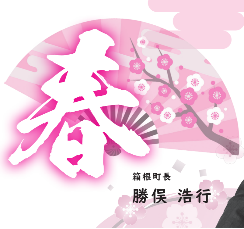
箱根町長 勝俣 浩行