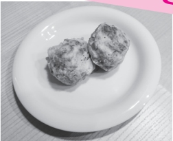
1人分の栄養価 エネルギー:152kcal 蛋白質:6.3g 脂質:10.0g 食塩相当量:0.8g

さといものコロッケ風 さといもは、秋から冬に収穫され2月下旬まで出回り、「開成弥一芋」や「しょうなんさといも」は、ねっとりとした食感などが特徴です。 さといもは、ふっくらと丸みがあり、傷がなく、皮に少しの湿り気とずっしりと重みがあるものを選びましょう。 照会先 さくら館 ☎85-0800