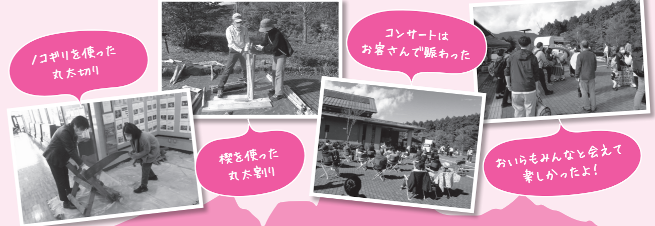
ノコギリを使った丸太切り