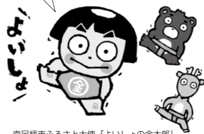
南足柄市ふるさと大使「よいしょの金太郎」

夕日の滝へは、伊豆箱根鉄道大雄山線「大雄山駅」から箱根登山バスで地蔵堂行24分「地蔵堂」バス停下車、徒歩20分だよ！