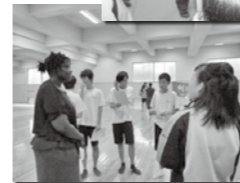
※事前に役を決めて実演練習(ALTとのロールプレイ)を実施しました。