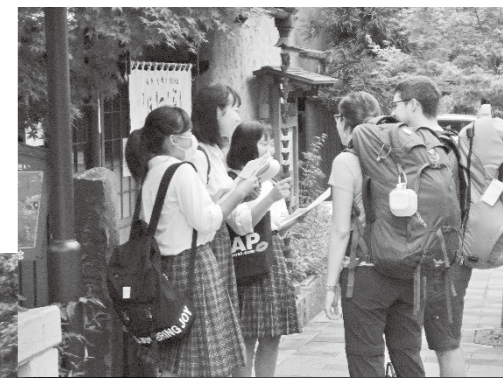
※外国人観光客へ英語で観光案内“まずは、世界共通ツールの笑顔で”