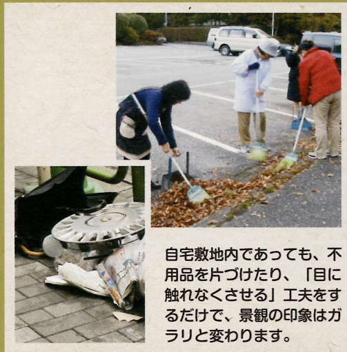
自宅敷地内であっても、不用品を片づけたり、「目に触れなくさせる」工夫をすることで、景観の印象はガラリと変わります。

人は自分を大事にしてくれる場所を歓迎します。これは景観という視点に置き換えても当てはまることで、結果おもてなしにつながっていきます。