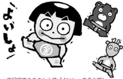
南足柄市ふるさと大使「よいしよの金太郎」

※バスは4、5、10、11月の運行となります。 また、足柄万葉公園や足柄城址に駐車場がありますのでそちらをご利用ください。