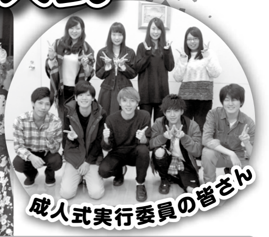
成人式実行委員の皆さん