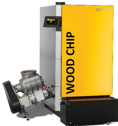
バイオマスボイラー