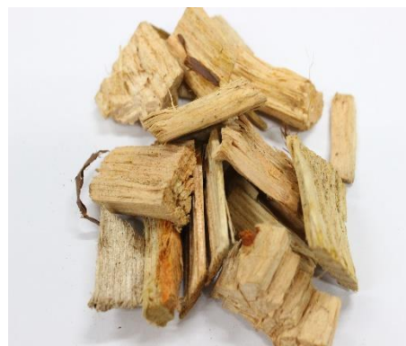
燃料となるウッドチップ